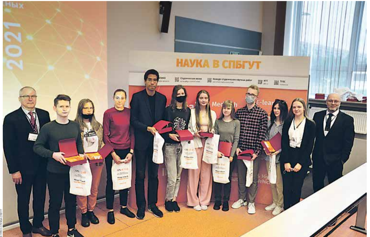
Награждение победителей конкурса студенческих работ, участников конференции «Студенческая весна — 2021»

Юбилейной — 75-й — стала региональная научно-техническая конференция студентов, аспирантов и молодых ученых «Студенческая весна — 2021». Ее участники представили