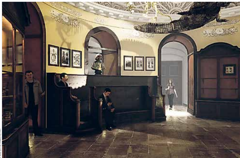
Эскиз экспозиции «Петровская Кунсткамера»

По замыслу Петра Кунсткамера является «прародительницей» российских музеев: ее коллекции хранятся во многих музеях России, сами идеи развития и создания музея зарождались именно здесь. Как отметила Н. П. Копанева, «Кунсткамера в XVIII веке была не только музеем, в котором хранились естественно-научные коллекции, художественные..., но и формировалась как музей отечественной истории, как первый национальный музей в России». Главный хранитель фондов музея рассказала, что на выставке впервые будут представлены экспонаты, которые до