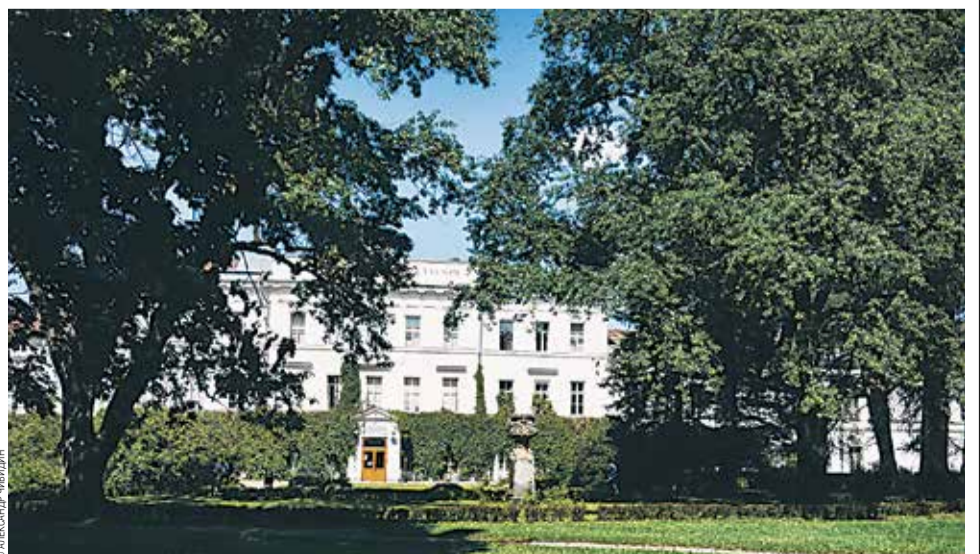
Здание Лесотехнического университета