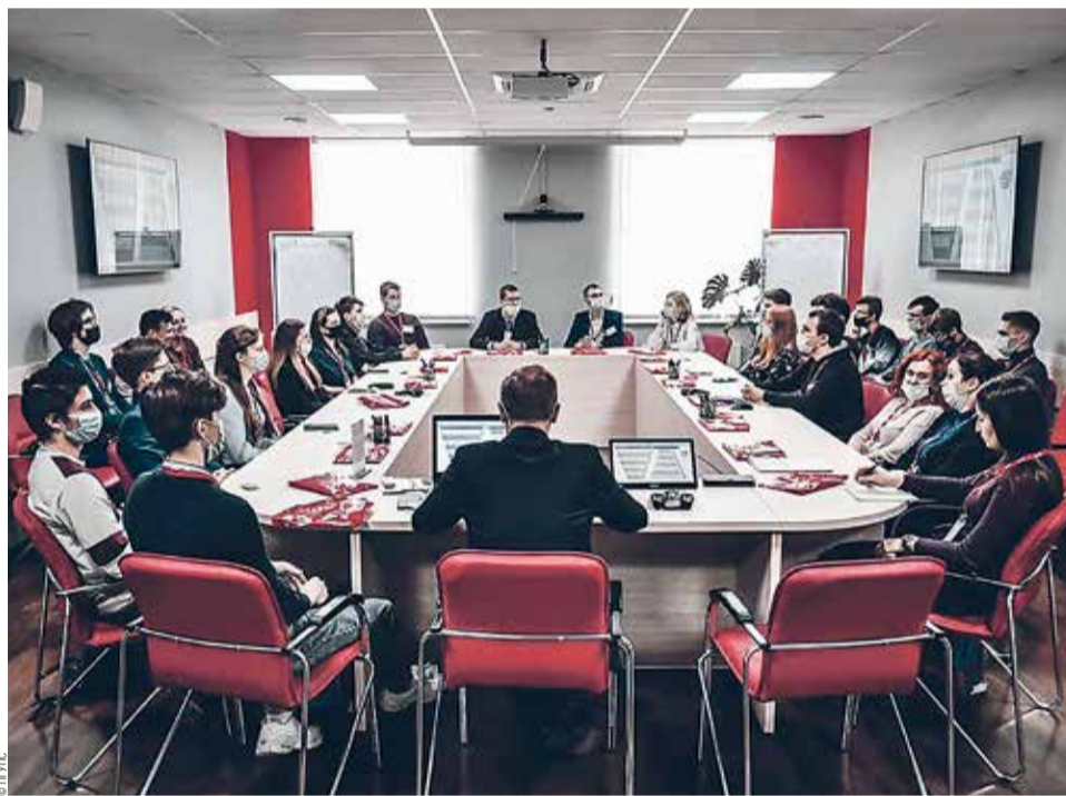
Встреча студентов ПГУПС со специалистами Региональной инновационной площадки Октябрьской железной дороги

Отметим, что основные участники проекта: ПГУПС, Октябрьская железная дорога и станция Санкт-Петербург-Сортировочный-Московский, являющиеся соответственно первым транспортным вузом, первой железной дорогой и первой железнодорожной сортировочной станцией России, всегда были инициаторами инноваций в транспортной сфере.