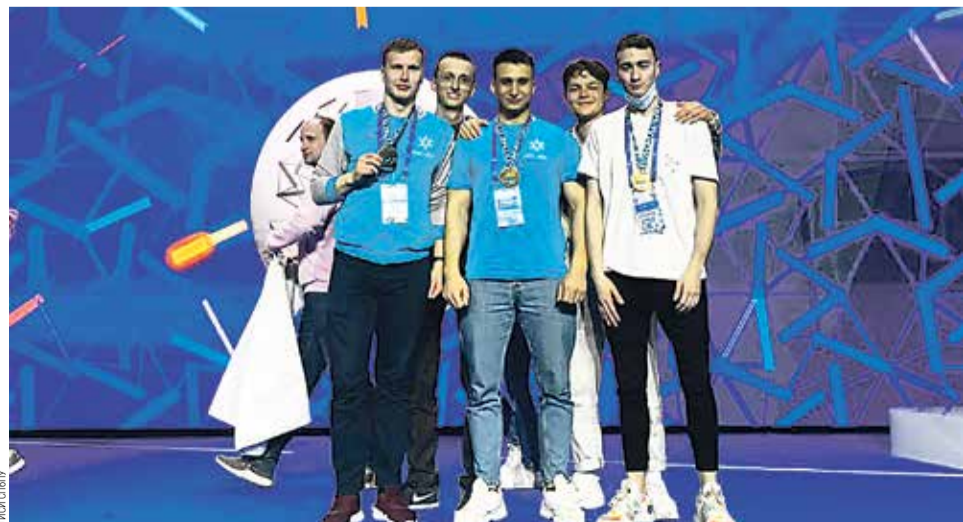
Команда студентов на награждении