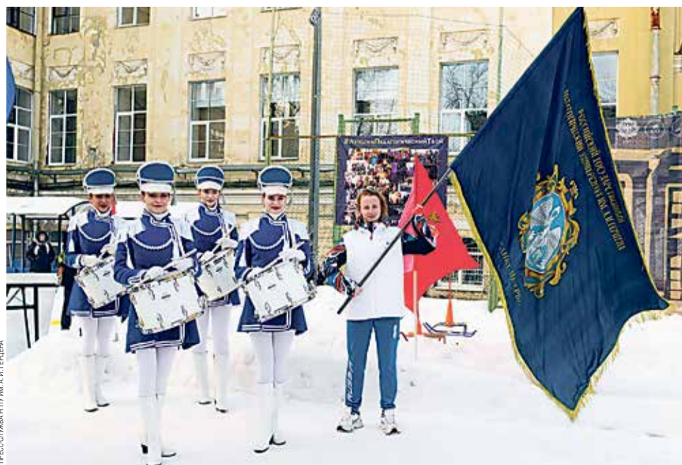
Торжественная часть праздника открывалась выносом знамени университета