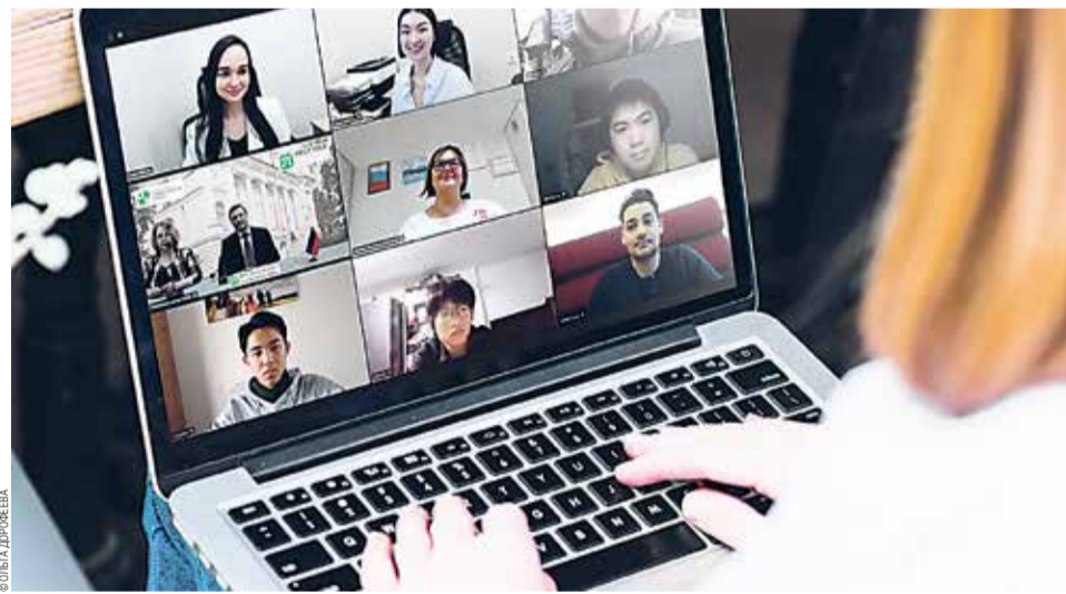
Международная политехническая зимняя школа 2022 проходит в режиме онлайн

— Программа зимней школы «Количественные финансы: финансовые рынки» стала результатом долгой и кропотливой работы команды Высшей инженерно-экономической школы Института промышленного ме-