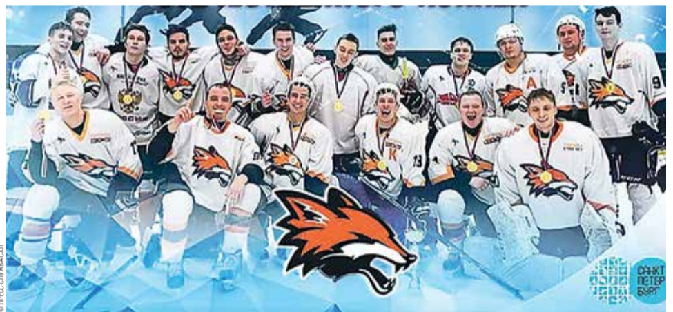
ХК «Лисы» (СПБГАСУ) обладатели кубка 75-летия отечественного хоккея

Студенческими играми отметила 75-летие отечественного хоккея Студенческая хоккейная лига Санкт-Петербурга (СХЛ), объединяющая под своим началом хоккейные сборные университетов Северной столицы России.