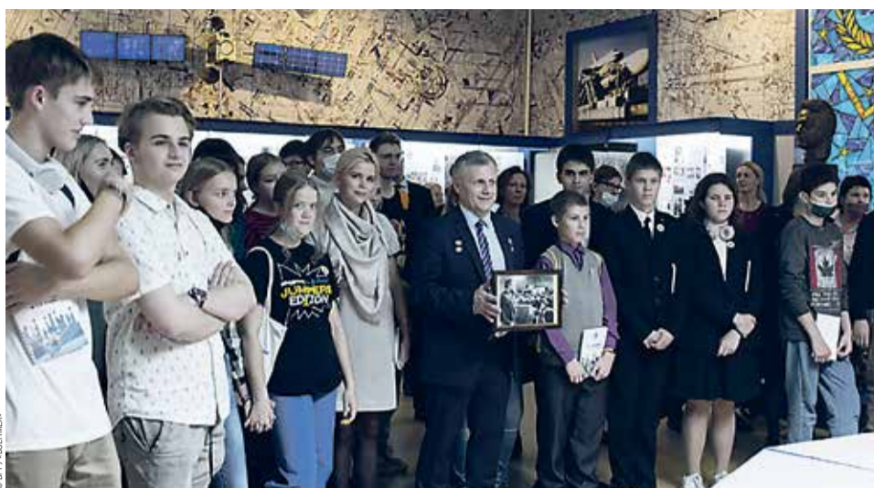
Открытие занятий в Инженерно-космической школе им. Г. М. Гречко. В центре — лётчик-космонавт А. И. Борисенко

Ну, и еще один аспект. Цифровая трансформация образования, несомненно, активизирует творческую работу преподавателей и повысит ее эффективность, например, за счет расширения онлайн-сотрудничества между преподавателями различных вузов и увеличения «активной составляющей» образовательного процесса, когда можно избежать рутинных операций и неизбежных в традиционной схеме повторов, например, таких как многократное чтение одних и тех же лекций перед различными аудиториями.