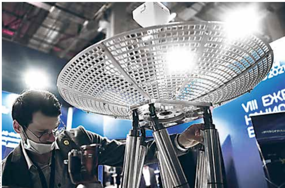
Военмех представляет свои экспонаты на выставке «ВУЗПРОМЭКСПО-2021»

Таким образом, образовательное сообщество, университеты должны в условиях цифровой экономики адаптироваться, и скорейшим образом, к новым реалиям. Каждое учреждение высшего образования должно пройти цифровую трансформацию, причем вне зависимости от выбранной им стратегии собственного развития. И это не столько разработка и внедрение неких технических и организационных изменений, сколько существенные структурные и, можно сказать, культурные, и организационные изменения в университете.