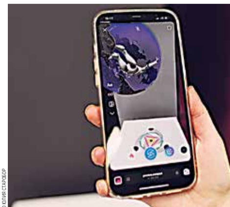
Объект цифрового искусства, разработанный студентом СПбГУПТД. Существует только в цифровом пространстве