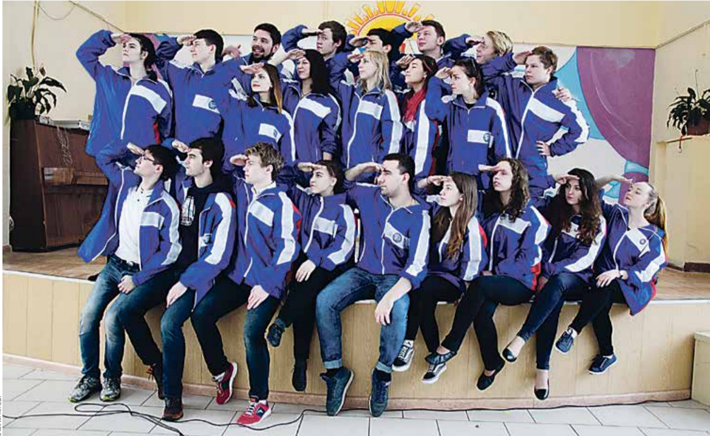
Репетиция выступления отряда

21 января был дан старт молодежной патриотической акции «Невский десант», в которой бойцы студенческих отрядов Петербурга и Ленинградской области принимают участие уже в восьмой раз.