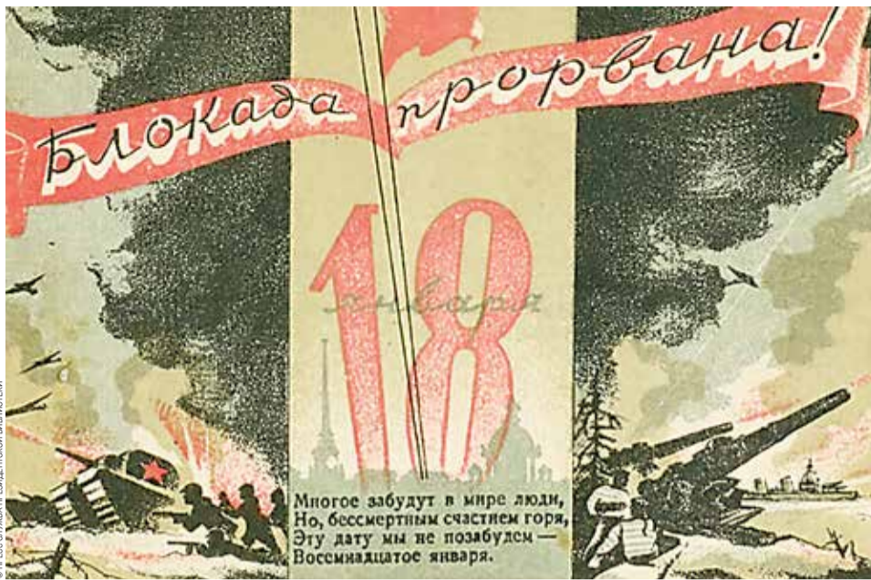
Блокада прорвана! 18 января. Худ. В. Соколов

Подвигом ленинградцев и защитников города гордилась не только родная страна. Президент США Франклин Рузвельт от имени