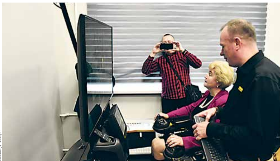
На открытии класса Ponsse в СПбГЛТУ

Реализация масштабной программы развития университета возможна прежде всего на основе объединения усилий всего коллектива. В прошлом году мы достигли высоких результатов, справимся с поставленными задачами и в 2022 г.!