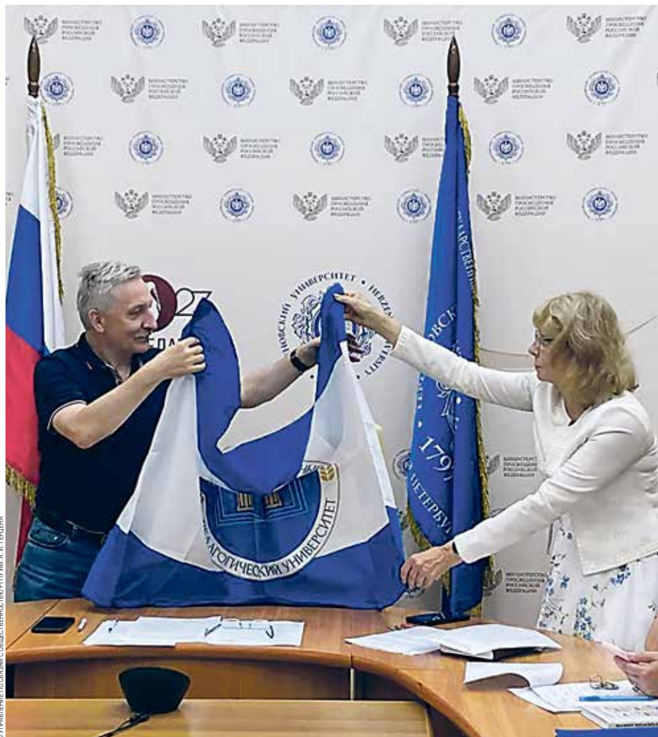
Подготовка к отправке флага ХГПУ в дар от РГПУ им. А. И. Герцена

Сотрудничество двух вузов уже достаточно обширное в разных сферах деятельности. В частности, научное сопровождение Херсонского государственного педагогического университета в настоящее время осуществляется в нескольких направлениях. Организовано методическое сопровождение открытия программ подготовки научных и научно-педагогических кадров высшей квалификации (программы аспирантуры) в ХГПУ. Ведется работа по прикреплению соискателей для подготовки кандидатских диссертаций без освоения программ подготовки научных и научно-педагогических кадров высшей квалификации (программы аспирантуры) преподавателями ХГПУ на базе кафедр РГПУ им. А. И. Герцена. Еще один важный шаг на этом совместном пути — подготовка к открытию диссертационного совета в ХГПУ по научным специальностям «Общая педагогика, история педагогики и образования» и «Методология и технология профессионального образования». Кроме того, организуется совместное определение перспектив развития сотрудничества в области научно-исследовательской деятельности студентов и профессорско-преподавательского состава ХГПУ и РГПУ им. А. И. Герцена, информирование студентов и преподавателей ХГПУ