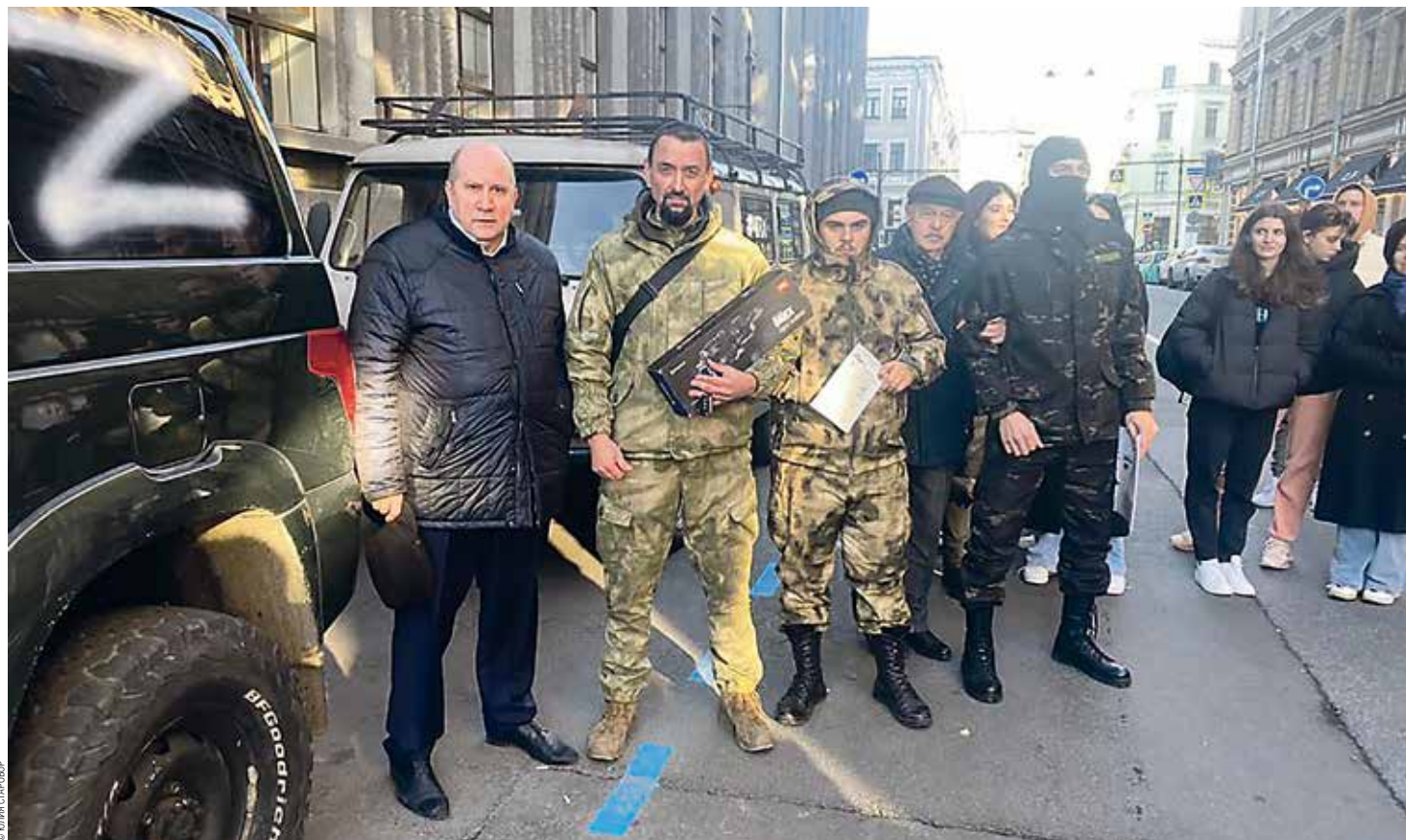
От здания Совета ректоров вузов Санкт-Петербурга и Ленинградской области на Большой Морской провозжат машины УАЗ на фронт

Высшая школа Санкт-Петербурга и Ленинградской области оказывала и оказывает материальную поддержку в виде сбора необходимых товаров первой необходимости, продуктов питания и медикаментов, закупает и отправляет на фронт автомобильную технику, тепловые пушки, ткани для маскировочных сеток и многое другое. Помню, как от здания, где распо-