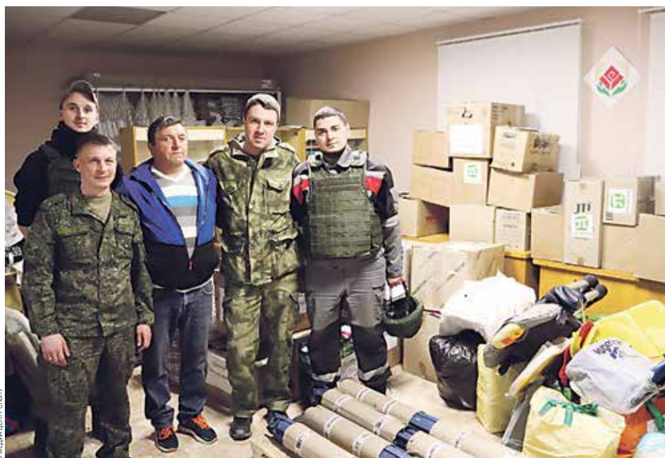
Передача гуманитарной помощи военнослужащим и жителям Запорожской области

снаряжение: средства связи, складные кровати, столы, стулья, спальные мешки. Благодаря этому в разы уменьшится время развертывания и свертывания пункта управления, что необходимо для быстрой передислокации. Также политехники отравили комплектующие для ремонта техники. В партию гумпомощи вновь вошли маскировочные сети, изготовленные студентами, сотрудниками и другими добровольцами.