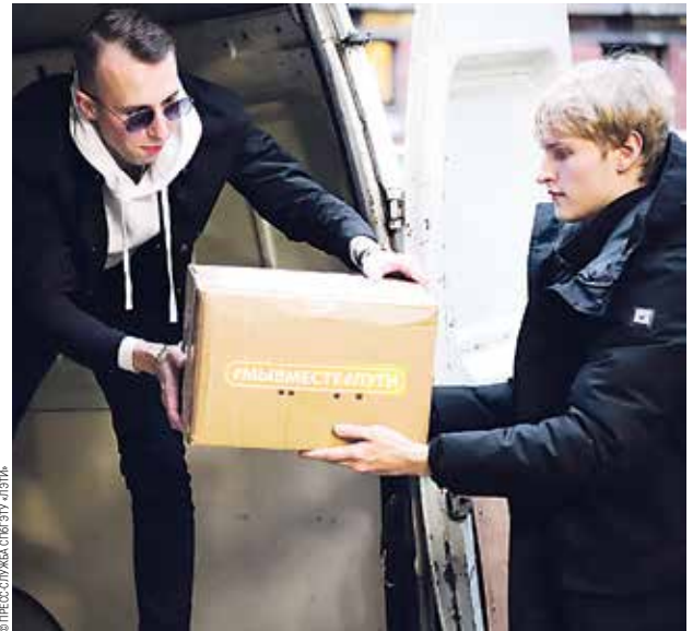
Свыше 500 кг гуманитарной помощи передано в Красный Крест

Тактические носилки «Фома-215» разработаны для быстрой эвакуации раненых в условиях боя, и их применение позволяет спасти военнослужащих, добровольцев и мирных жителей, находящихся в зоне спецоперации. Носилки изготавливаются из стропы, комплектуются специальной сумкой с креплением «молле», эвакуационной стропой с карабинами.