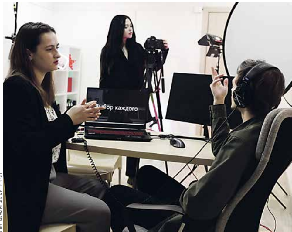
Съемочная группа фильма в процессе монтажа