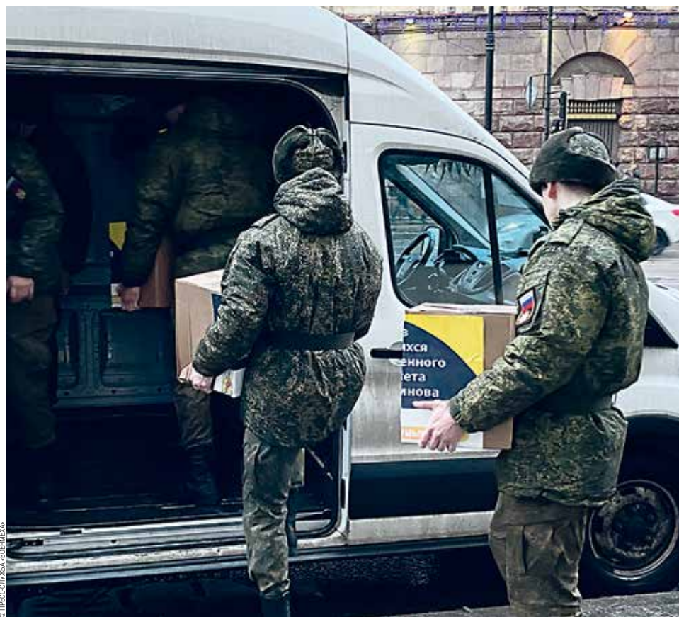
Студенты Военного учебного центра загружают гуманитарную помощь на отправку

Именно с таким девизом осенью 2022 г. студенты Военмеха, активисты Волонтер-