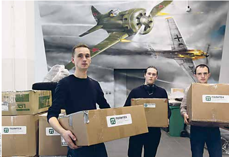
Подготовка очередной партии гуманитарной помощи к отправке

В сентябре Политехнический университет отправил очередную партию гуманитарной помощи в зону специальной военной операции. На этот раз большое внимание уделили организации мобильного пункта управления. Сотрудники Политеха подобрали и закупили туристическое