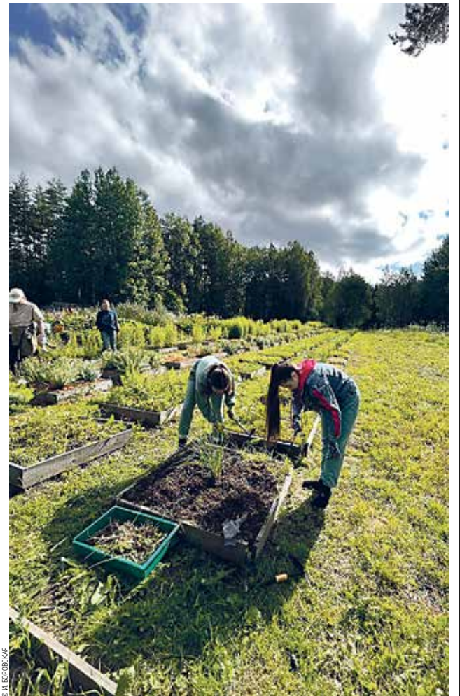
Практика в питомнике СПХФУ