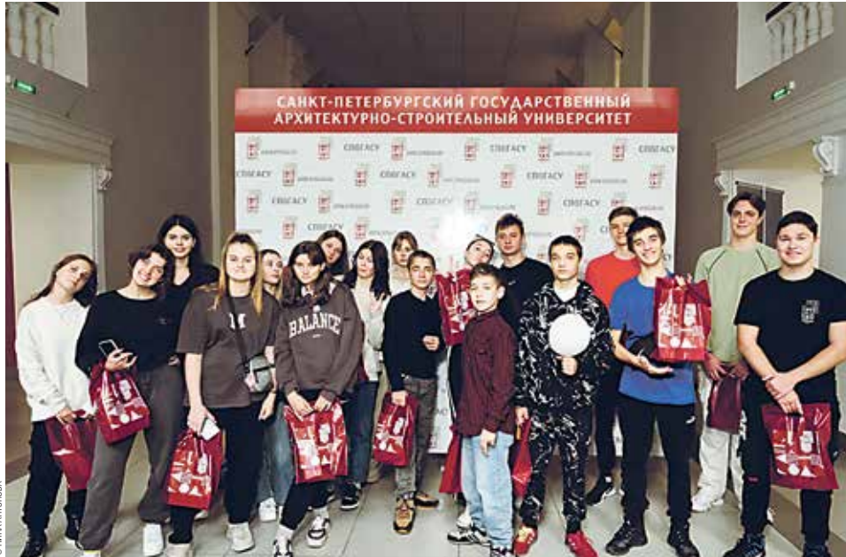
Школьники Херсонской области на закрытии «Университетской смены»

Познакомиться с историей города и страны, архитектурой исторических зда-