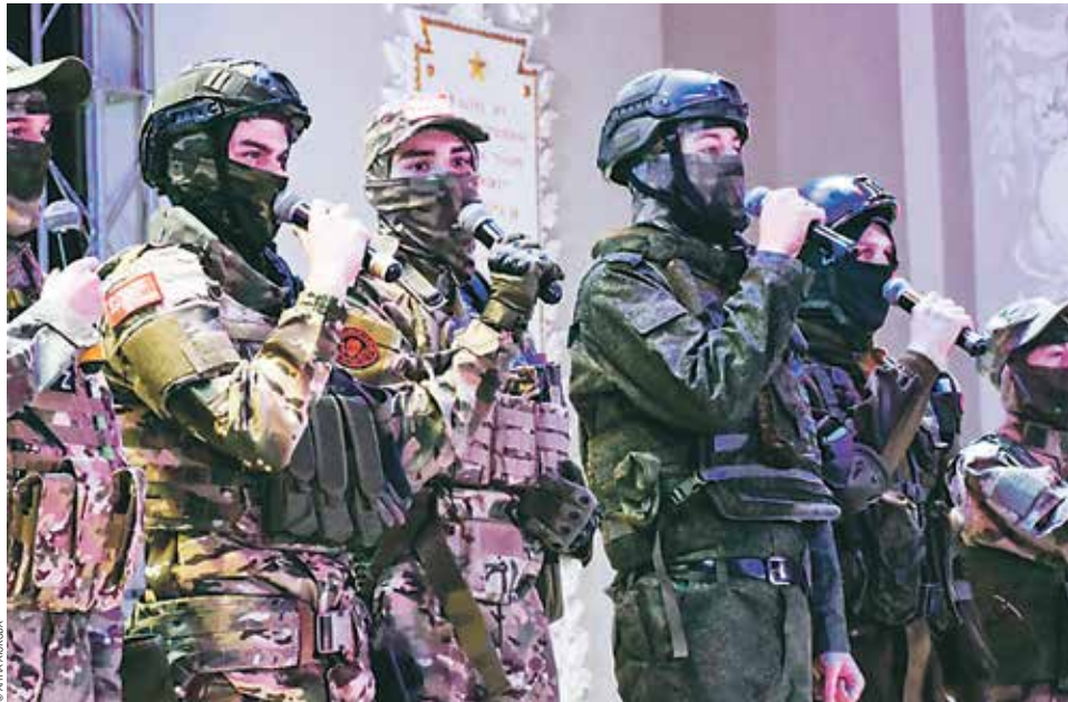
Патриотическое мероприятие в Лесотехническом университете «В единстве со СВОими»

Эти неравнодушные люди не занимаются продажей своих уникальных сетей и нашлаемников. Всё изготавливается для бойцов бесплатно! Ткань, шнуры и другие необходимые материалы закупаются оптом.