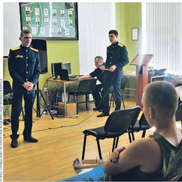
Концерт в госпитале

Сотрудники и студенты академии были задействованы в работе круглого стола в Санкт-Петербургском государственном университете, посвященного проблеме сохранения и