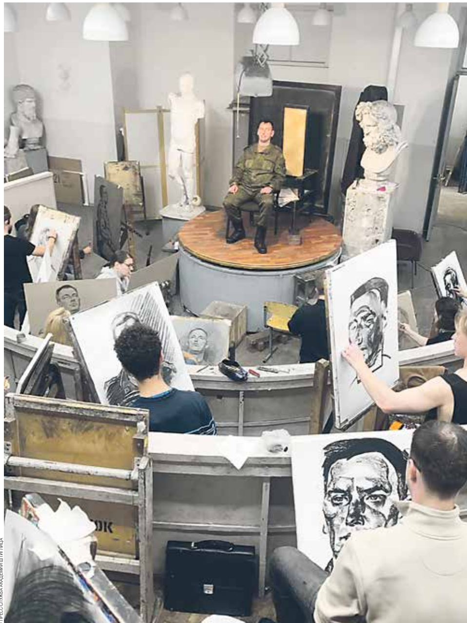
Сессия рисунка. Студенты и преподаватели Академии Штиглица рисуют портрет военного