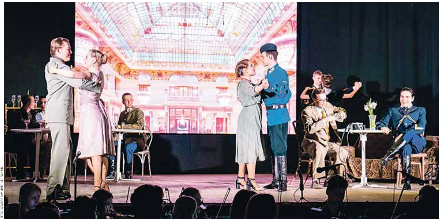
Сцена из спектакля «Жди меня»