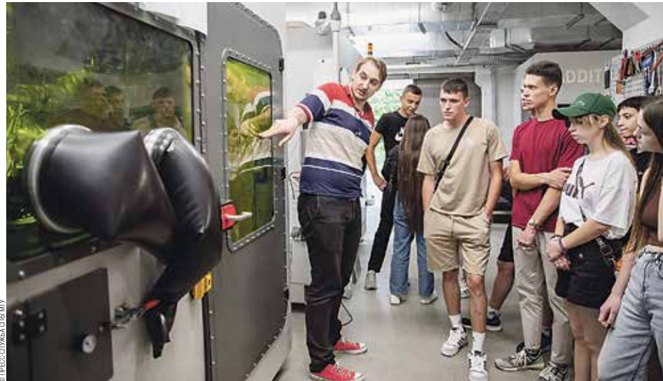
В Институте лазерных и сварочных технологий СПбГМТУ гости увидели, как выращивают детали

В августе Корабелка встречала группу старшеклассников одной из донецких школ. За неделю занятий в вузе гости познакомились с университетом и приобрели новые знания и навыки. Каждый