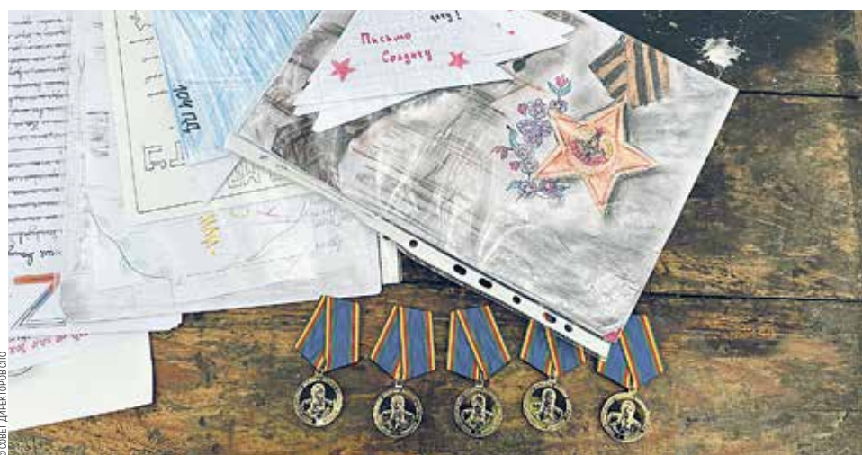
Памятные подарки и медали из Санкт-Петербурга

СВО. На фронт передано около 1 тонны гуманитарной помощи. В госпиталь Санкт-Петербурга при содействии благотворительной организации «Дом под покровом» студенты передали подарки и пожелания, наполненные теплом, заботой и теми эмоциями, которых так не хватает вдали от дома.