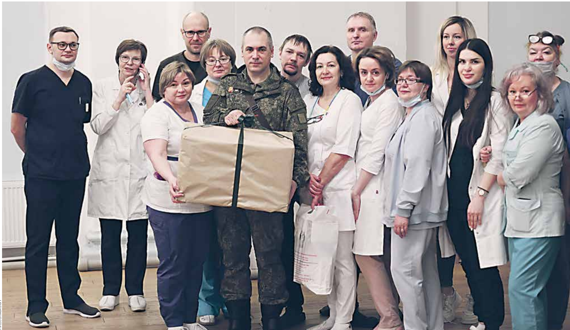
Сотрудники Клиники высоких медицинских технологий им. Н. И. Пирогова СПбГУ

Санкт-Петербургский государственный университет (СПбГУ) поддерживает участников СВО, детей участников СВО, сотрудников и обучающихся, оказавшихся в сложной ситуации, а также готов помогать всем россиянам, столкнувшимся с русофобскими проявлениями.