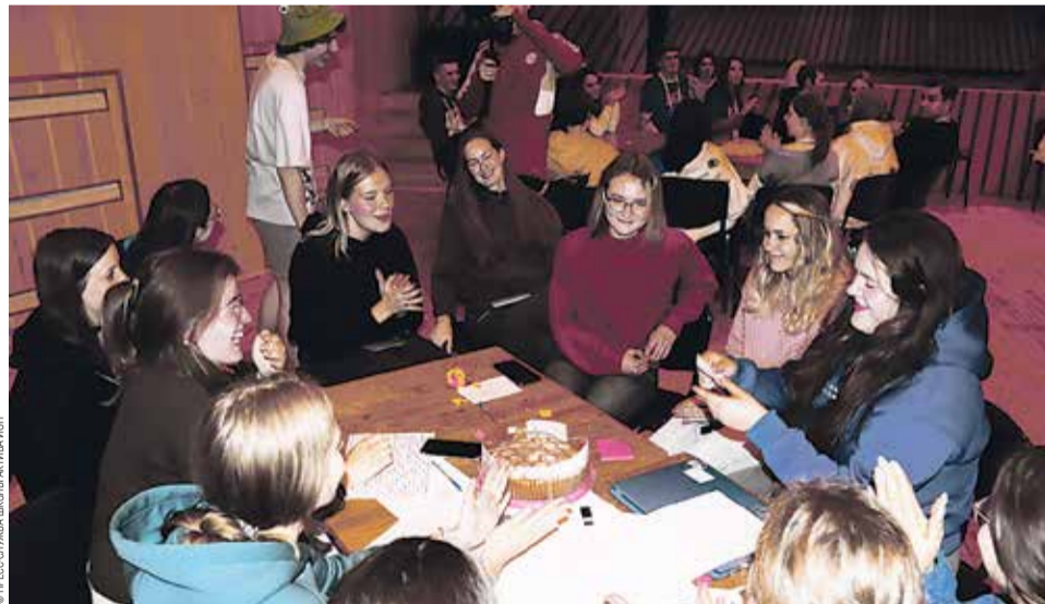
Участники Школы актива ИОН

— Да, была впервые. Первый курс, первый уровень. Мне понравилась работа в активной команде. Кураторы очень постарались для того, чтобы быстро сплотить незнакомых людей в маленькую «се-