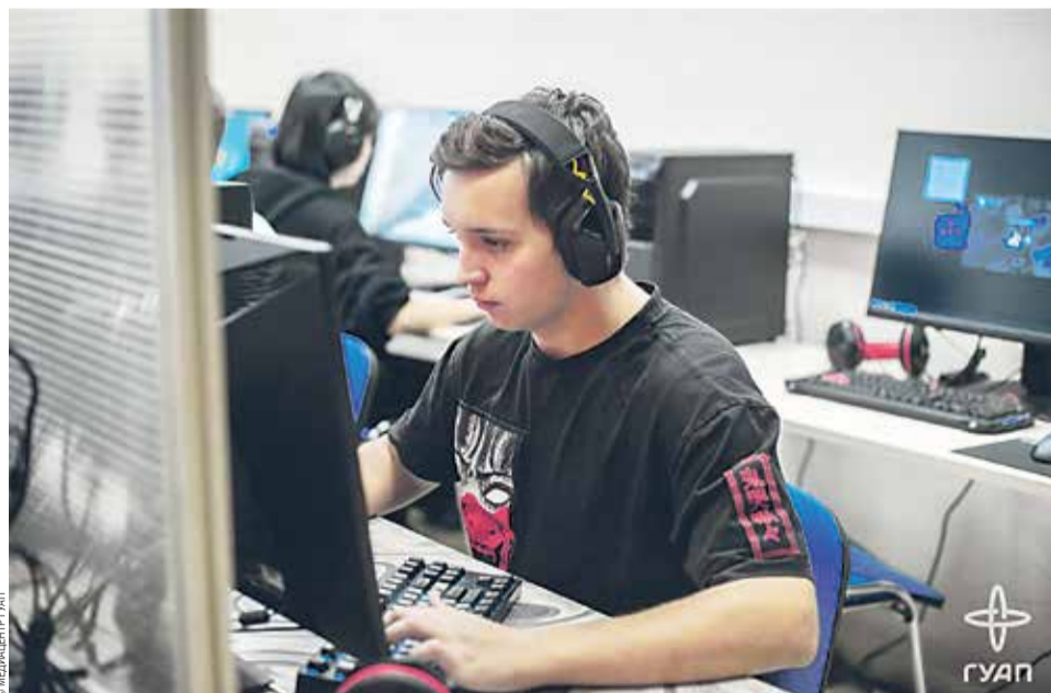
Участники форума «Время IT»

— Сфера IT является одним из лидеров по уровню окладов на российском рынке труда и уступает в этом отношении только добывающей отрасли, находясь на одном уровне с нефтегазовым сектором. При этом начинающие IT-специалисты почти всегда сталкиваются с низким зарплатным стартом, — уточнила спикер.