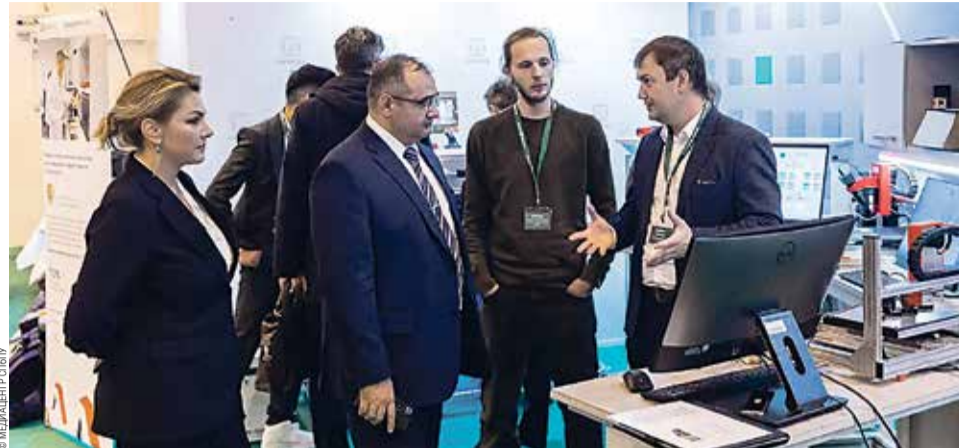
Участники проектно-аналитической сессии

— Потенциал Политеха впечатляет. Цель экспертов — помочь сотрудникам вуза самим увидеть и обозначить наиболее критичные управленческие аспекты, выявить сильные и слабые стороны. Не бывает так, чтобы система, ядром которой является проектная команда, всегда работала идеально. Свежий критичный взгляд специалиста со стороны позволяет внести улучшения. Проектно-аналитические сессии проводятся как раз для того, чтобы выявить риски, увидеть незадей-