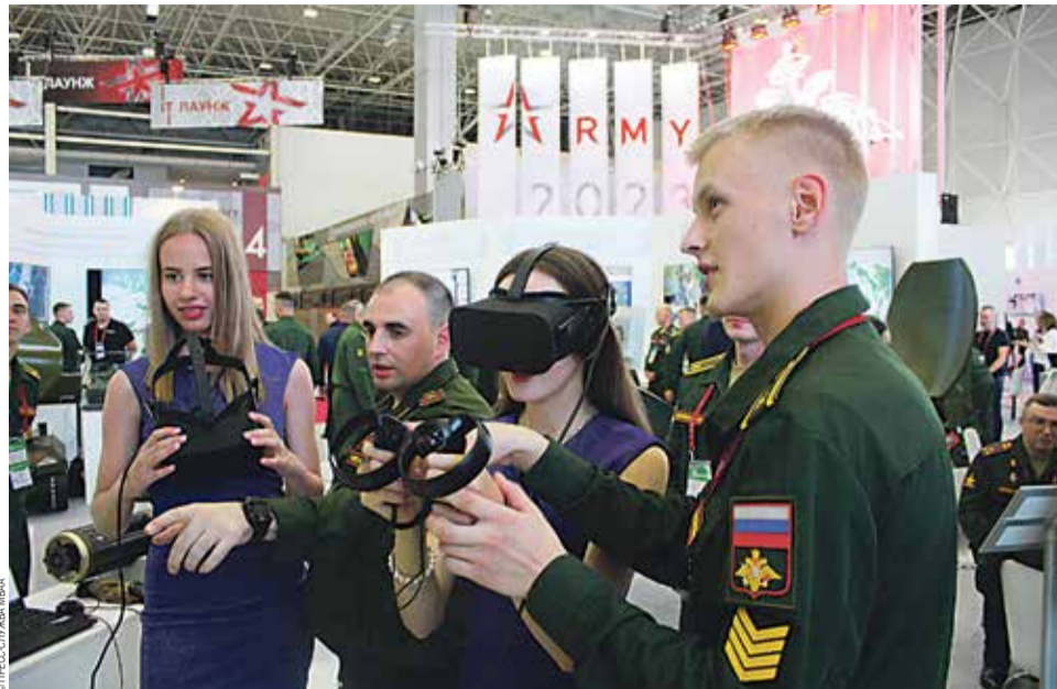
Стенды МВАА вызвали огромный интерес у всех гостей форума

Тренажер Михайловской академии «Артерра-ВТ-3D» продемонстрировал обучающие возможности средств компьютерного моделирования реального боя с учетом опыта специальной военной операции. В обстановке боевого эпизода в Запорожье 6 июня 2023 г., когда вошедший в легенду российский танк «Алеша» противостоял целой колонне боевой техники