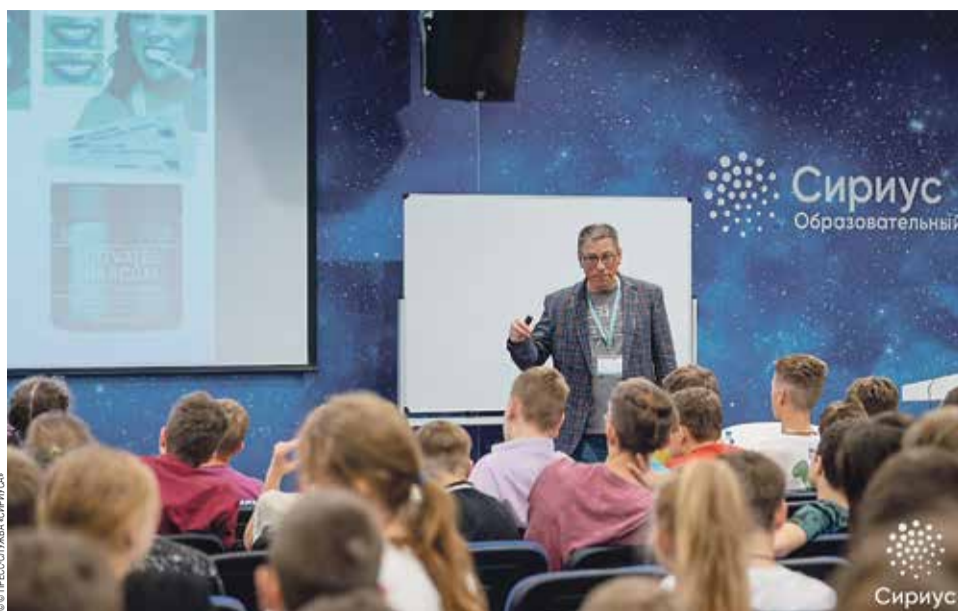
В образовательном центре «Сириус» прошла смена «Физика. Старт в науку», соорганизатором которой был Лицей «ФТШ» им. Ж. И. Алфёрова

— Важно отметить, что развитие Академического университета как единого целого основано на интеграции трех составных частей — научной деятельности, высшего образования, Физико-технической школы, что было подчеркнуто Президентом России Владимиром Путиным на встрече в Сарове 8 сентября 2023 года. Лицей «Физико-техническая школа» имени Ж. И. Алфёрова широко известен в стране и мире, он входит в число лучших российских школ по всем образовательным рейтингам. Большинство выпускников поступают в ведущие университеты страны. Только в 2022/23 учебном году 16 учащихся лицея стали победителями и призерами заключительного этапа Всероссийской олимпиады, 15 учителей получили премию правительства Санкт-Петербурга в области образования, двое учащихся получили медали международных олимпиад.