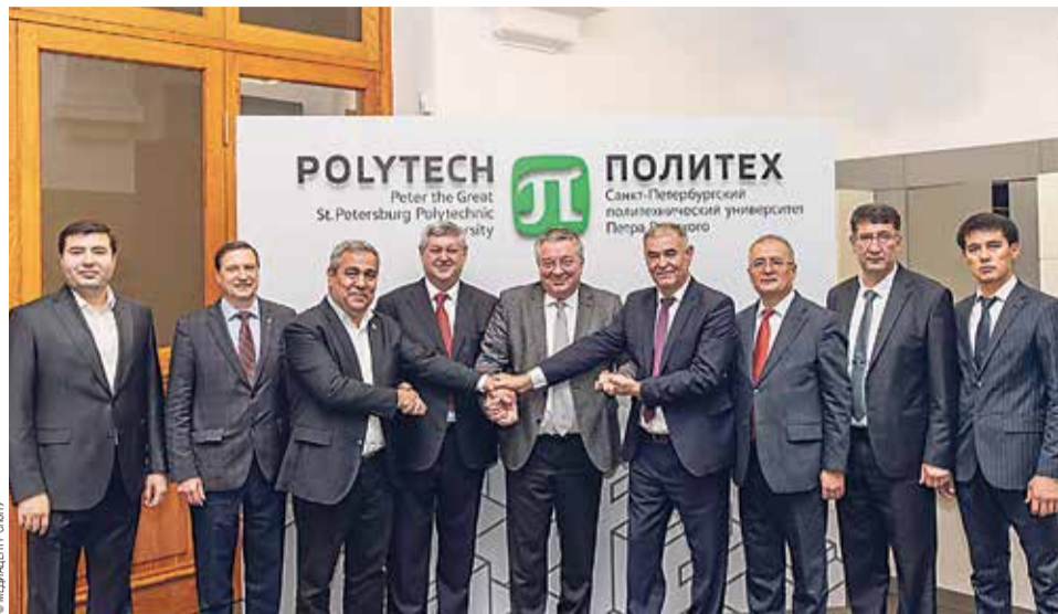
Визит руководителей университетов Узбекистана

В рамках форума Политехнический университет принял представительную делегацию ведущих вузов Узбекистана. Среди гостей были руководители Ташкентского государственного технического университета имени Ислама Каримова (ТГТУ), Самаркандского государственного универ-