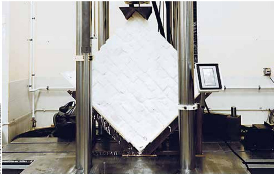
Кирпичная кладка перед экспериментом

чтобы создать в ее средней зоне главные растягивающие напряжения и оценить их влияние на процесс образования трещин и разрушения кладки, тем самым воссоздав напряженно-деформированное состояние кирпичной кладки при разности осадок основания. Во время испытания с помощью датчиков перемещения и прогибомеров измерялись горизонтальные и вертикальные деформации. Кроме того, велась инженерно-сейсмометрические измерения с целью определить момент образования трещин и оценить сплошность конструкции. Разрушение первого образца произошло при нагрузке 186,6 кН (19 т) от действия главных растягивающих напряжений.