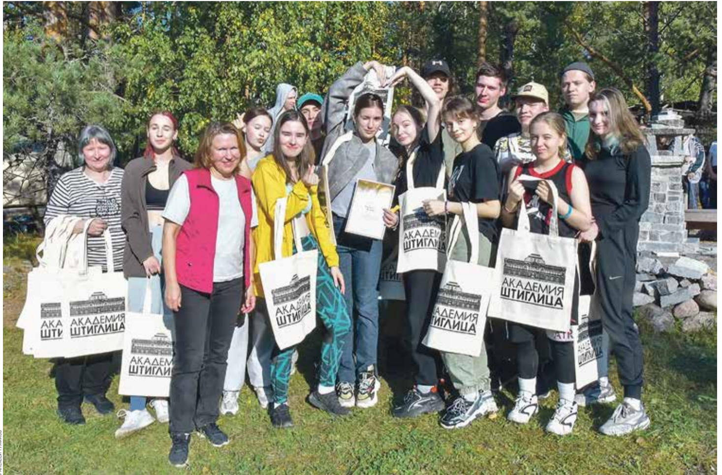
Участники туристического слёта