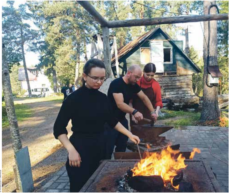
Мастер-класс на пленэрной базе

— Карелия — это прекрасный край, вдохновляющий многие поколения художников. Хочется, чтобы каждый студент академии приехал и увидел эту неописываемую красоту — с одной стороны Вуокса, а с другой —